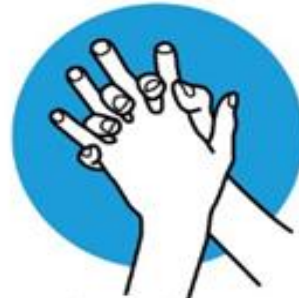
Zwischen den Fingern